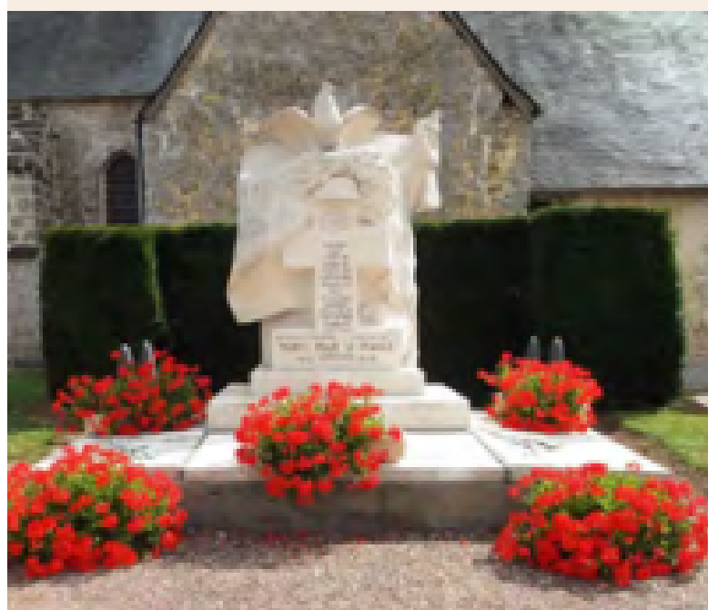
Monument aux morts à Cuy-Saint-Fiacre

Tous les 500 mètres, une borne vous indique la distance avec la gare Saint-Lazare, à Paris.